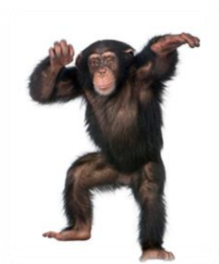
Limbický systém (savčí / emoční mozek)