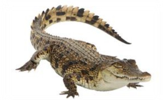
Reptiliánský mozek (plazí / instinktivní mozek)