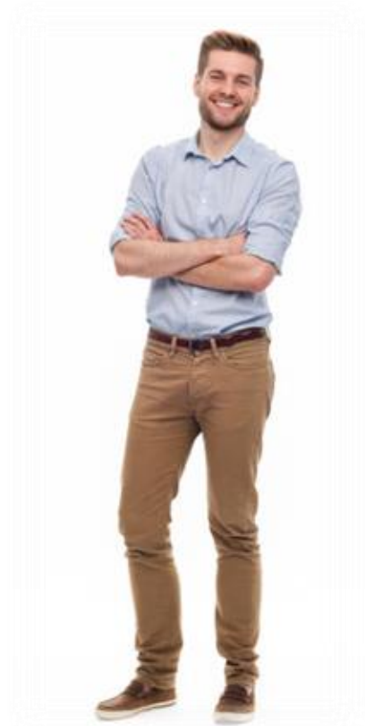
Neokortex (lidský / racionální mozek)